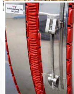
Système de tension hybride pour clé de 8